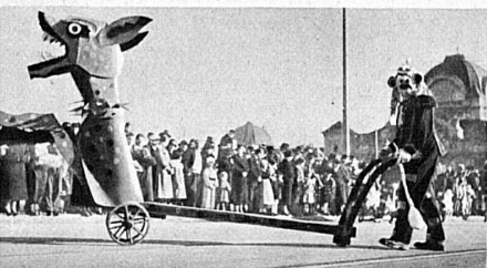
Der Fritschi-Umzug in Luzern findet am 24. Februar 1938, nachmittags, statt.

Auskunft unter «Skiferienreisen» bei der Berninabahn, Poschiavo.