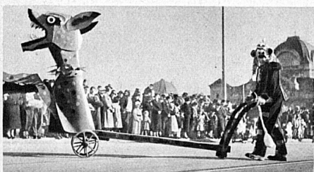
Der Fritschi-Umzug in Luzern findet am 24. Februar 1938, nachmittags, statt.

Auskunft unter «Skiferienreisen» bei der Berninabahn, Poschiavo.