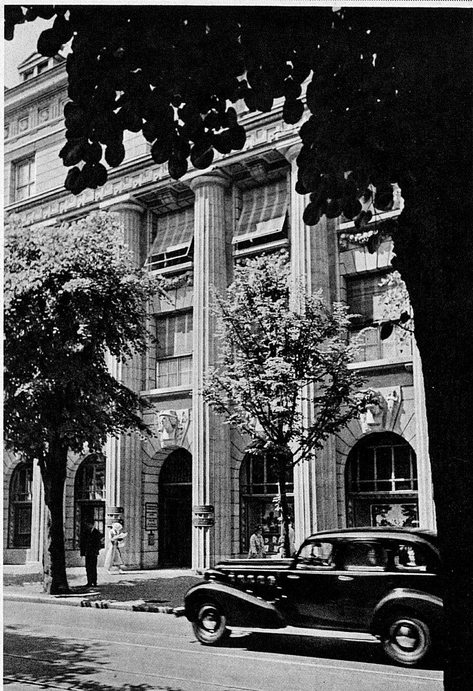
Eingang zum Bankgebäude in Zürich