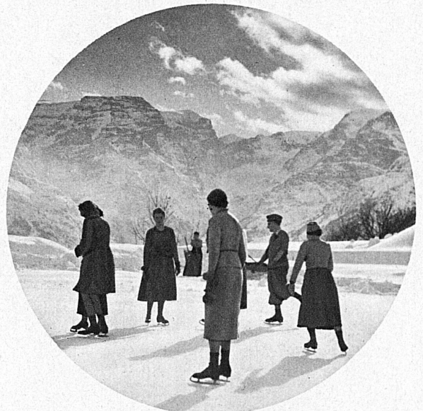
Diesmal ging es nach Braunwald. Und hier geniessen die Teilnehmer gegen Vorweisung des Billetts freien Eintritt auf der Eisbahn