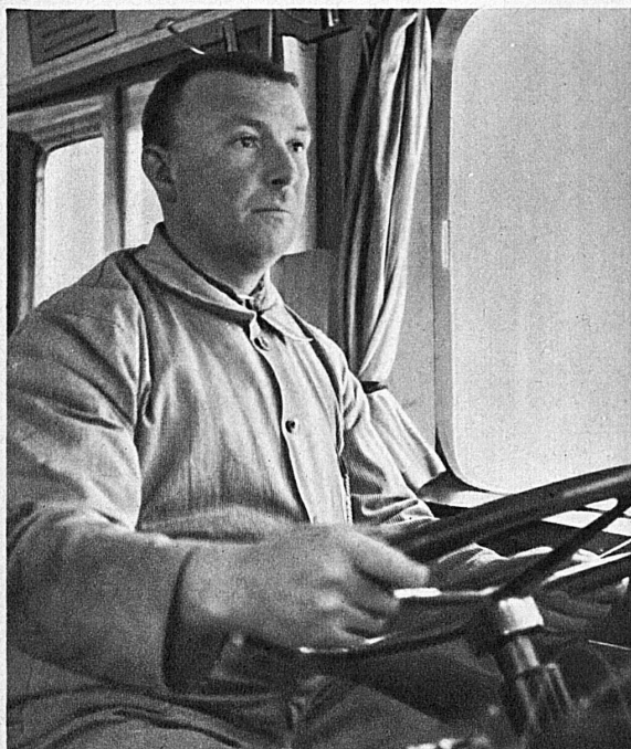
Der Führer des Roten Pfeils am « Volant »