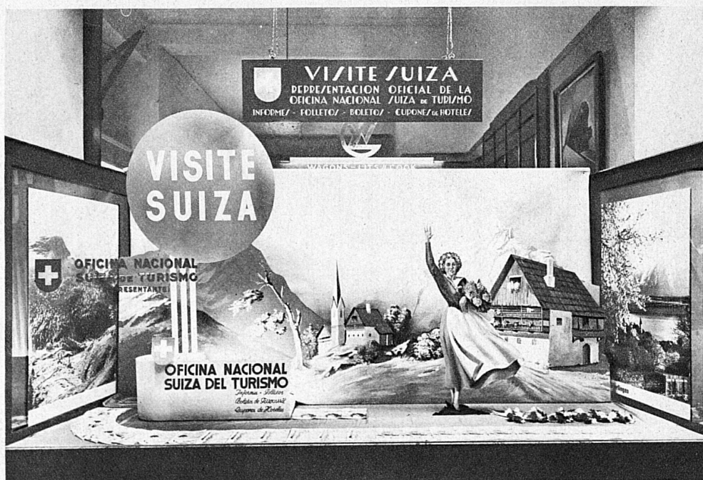
Schaufenster im amtlichen Schweizer Verkehrsbüro in Buenos Aires, das unter der Leitung der Schweizerischen Verkehrszentrale steht — Vitrine de l'office suisse de tourisme de Buenos Aires, placé sous la direction de l'ONST

Ostermans Marmorhallen, verbunden mit Vorträgen markanter schweizerischer Persönlichkeiten mit Darbietungen schweizerischer moderner Musik, mit Vorführungen von schweizerischen Kulturfilmen. In der Ausstellung befand sich ein ausgezeichnetes Restaurant, in dem die regionalen Spezialitäten der Schweiz serviert wurden. Die Schweizerwoche in Stockholm, veranstaltet von der Schweizerischen Verkehrszentrale, der Zentrale für Handelsförderung, der Landesausstellung und dem Auslandsschweizersekretariat, wurde in Anwesenheit des schwedischen Kronprinzen eröffnet und am dritten Ausstellungstage sogar von dem 80jährigen König von Schweden mit einem einstündigen Besuche beehrt.