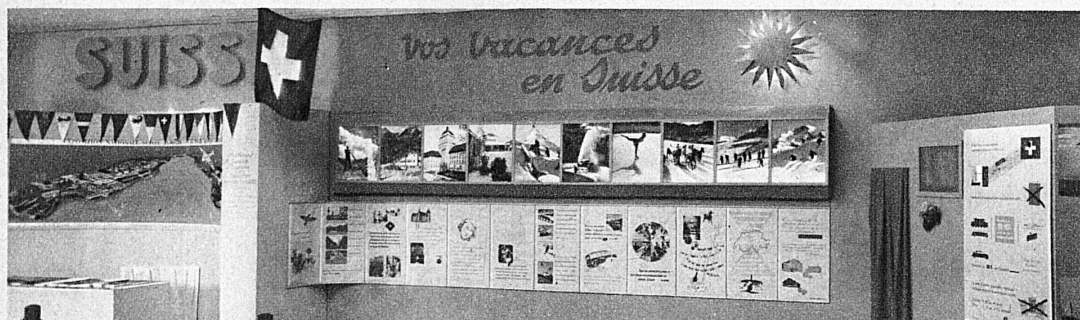
Die Schweizer Verkehrszentrale wirbt an der Mustermesse von Marseille für Schweizer Winterferien und für die Landesausstellung — Propagande de l'ONST pour les vacances d'hiver en Suisse et pour l'Exposition nationale à la Foire de Marseille