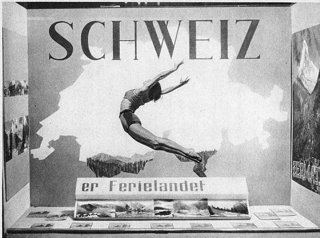
Sommerschaufenster in Kopenhagen — Vitrine de propagande pour l'été à Copenhague