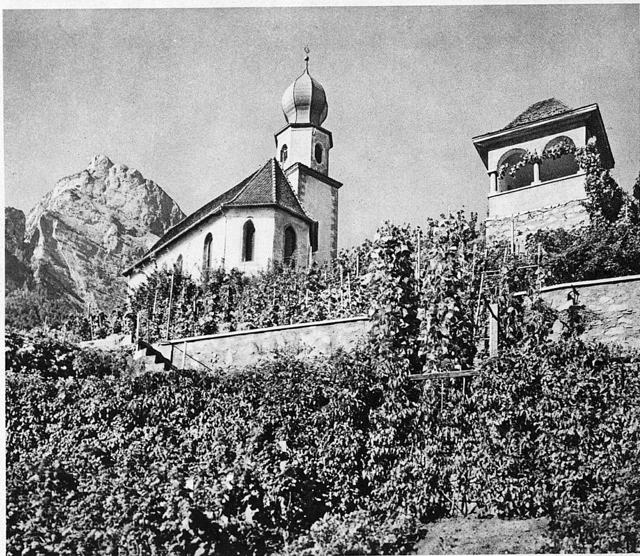
Die prächtig gelegene Kirche und das reizvolle Aussichtspavillon — L'église, merveilleusement située au-dessus de la vallée du Rhin