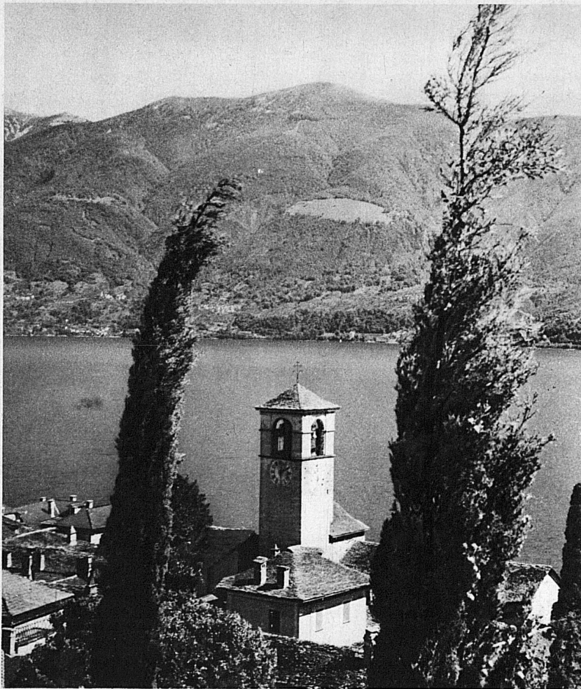
Brissago und der Lago Maggiore — Brissago et le Lac Majeur

Brissago hatte nie den Ehrgeiz, am verkehrsreichen Heerweg zu liegen. Man muss dieses südlichste schweizerische Uferdorf am Lago Maggiore in der Stille geniessen, und dazu lädt die goldene Herbststimmung des Tessin ganz besonders ein. Auf drei Wegen kann man von dem belebten Locarno zur Bucht von Brissago gelangen. Die bequeme Postautostrasse führt über Ascona dem aussichtsreichen Ufer entlang nach Brissago; das Schiff macht den weiten Bogen um das Maggiadelta, und ein herrlicher Spazierweg wendet sich von Locarno aus nach Losone und dem prachtvoll gelegenen Ronco, um dann durch Kastanienhaine in das friedvolle Uferdorf mit seinen schönen, alten Bauten zu gelangen.