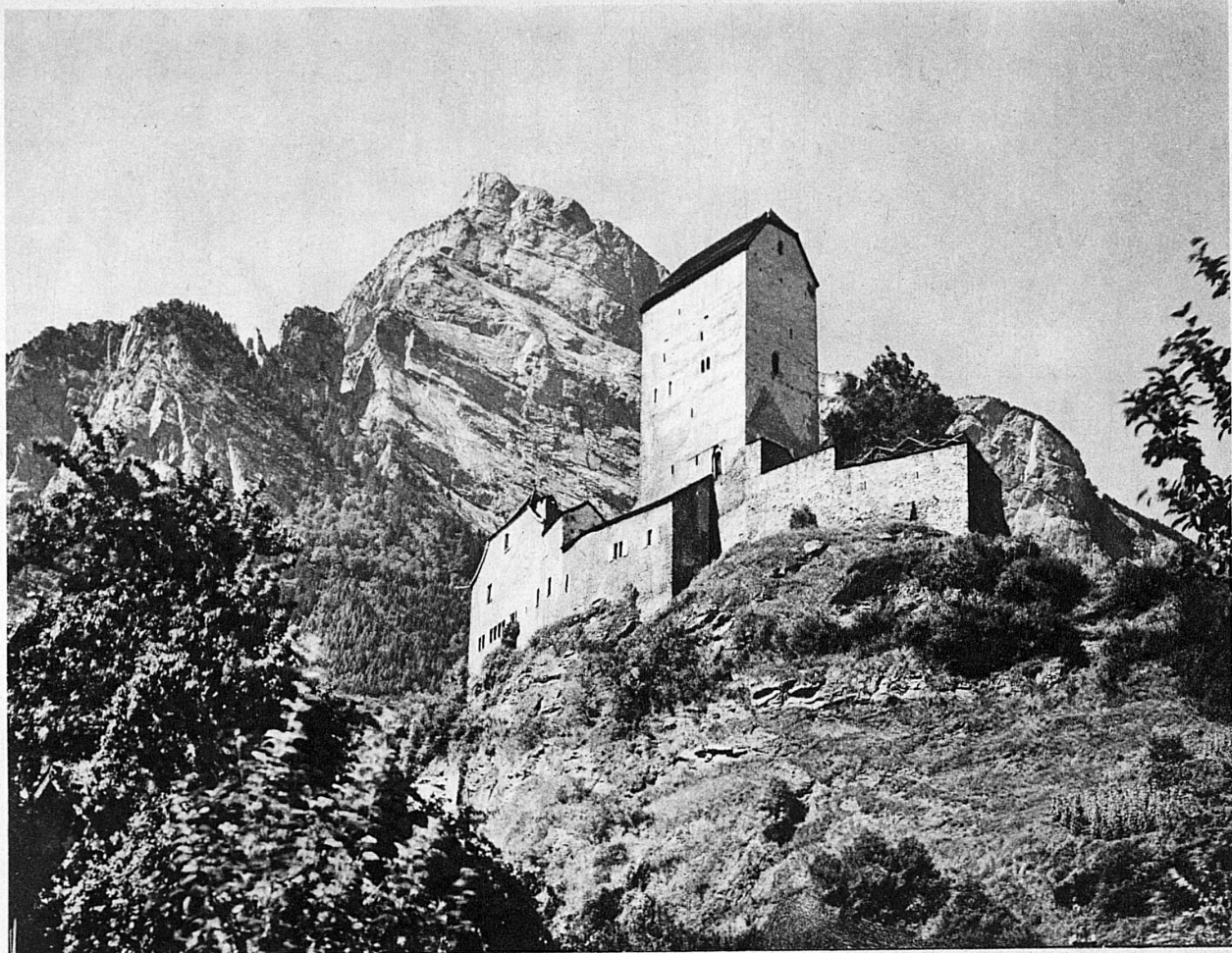
Schloss Sargans, das der Gemeinde gehört und besichtigt werden kann. Im Hintergrund der Gonzen — Le château de Sargans, propriété de la commune, peut être visité. Au fond le Gonzen