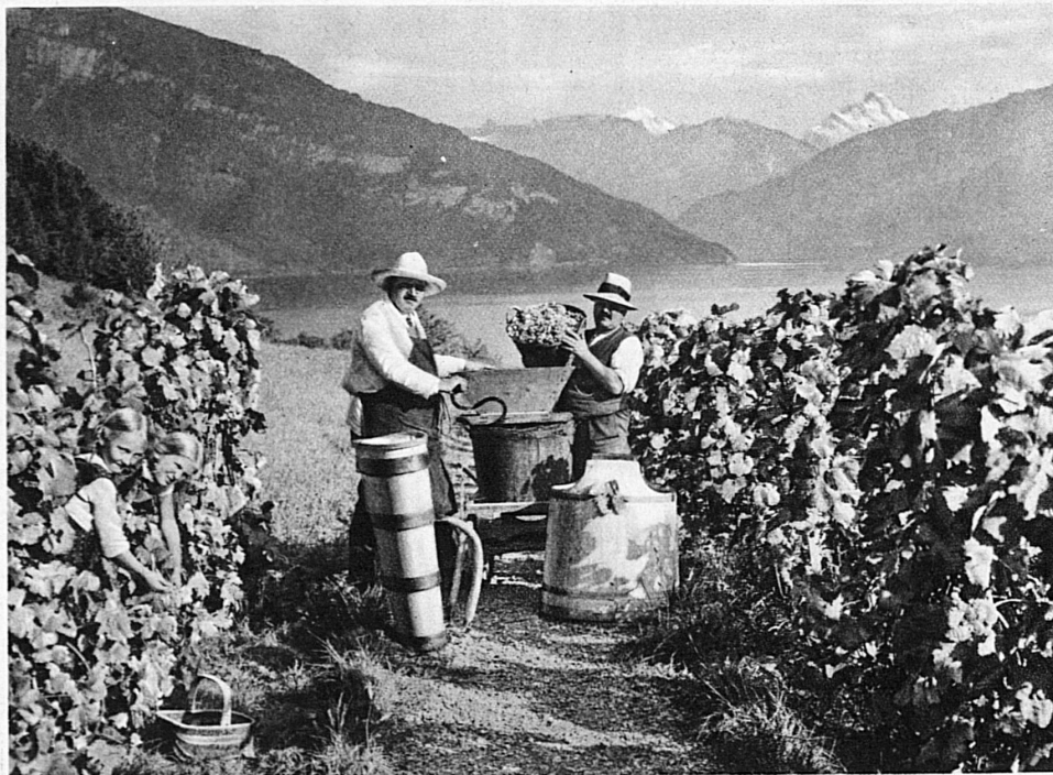
Vendanges au bord du Léman — et au bord du Lac de Thoune — Weinlese am Genfersee — und am Thunersee