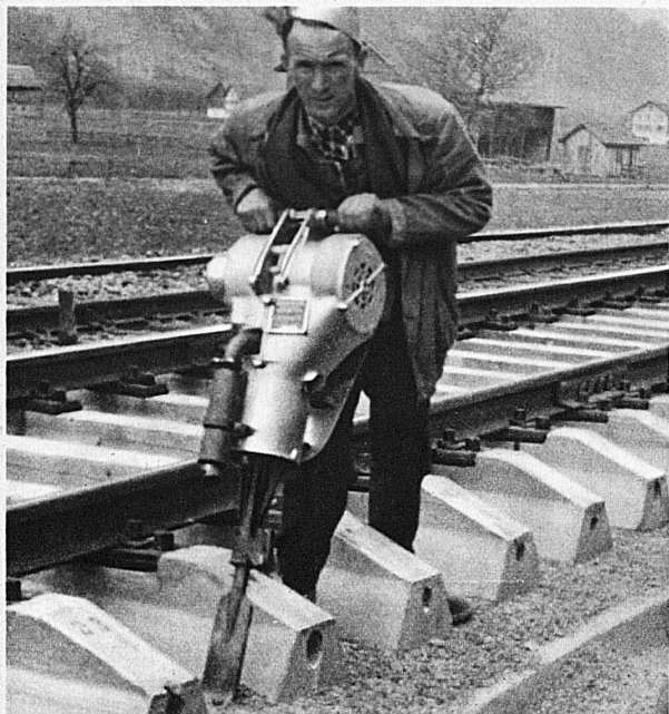
Kleiner Motorkompressor der Firma Brun u. Cie., Nebikon — Petit compresseur à moteur de la maison Brun et Cie., Nebikon