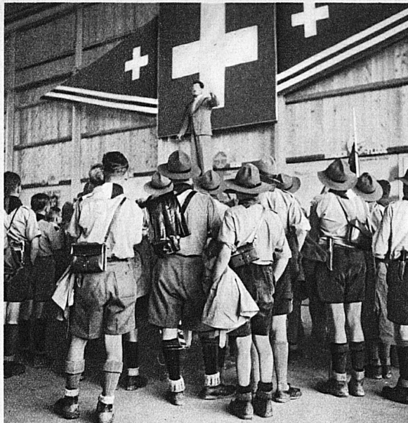
Auf der Plattform vor dem Hangar der Swissair ist ein grosses Pfadi-Lager aufgeschlagen worden. Im Hintergrund das Gross-Expressflugzeug Douglas D. C. 3 — Les éclaireurs devant le hangar de la Swissair. Au fond un avion express Douglas D. C. 3