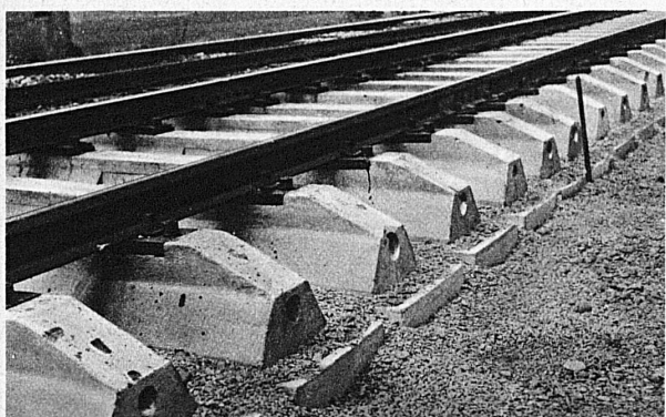
Betonschwellen — Traverses en béton