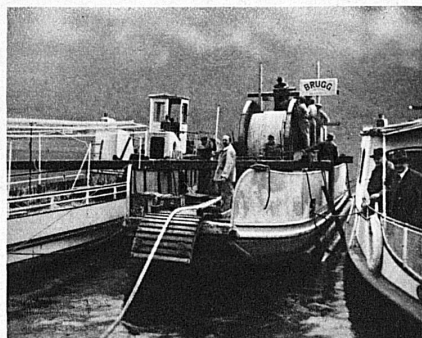
Verlegung eines Telephonkabels im Luganersee zwischen Morcote und Brusino für die Post- und Telegraphenverwaltung. November 1934