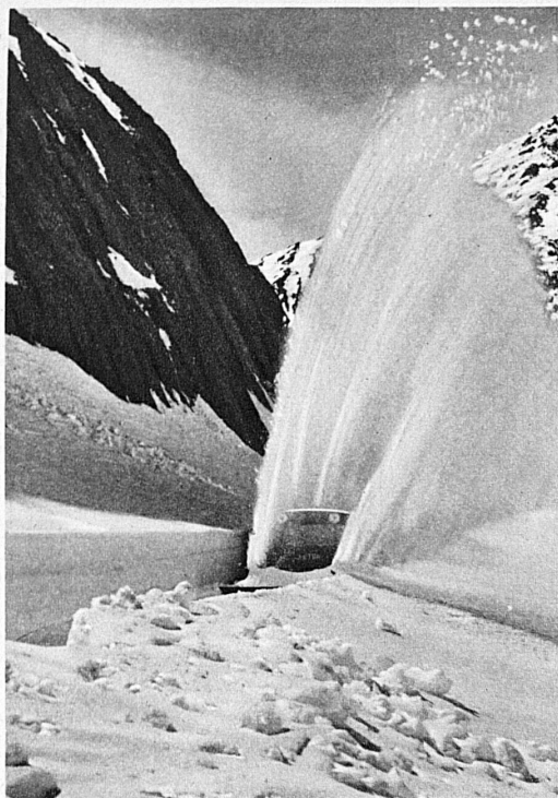
Öffnung der Gotthardstrasse im Frühjahr 1938