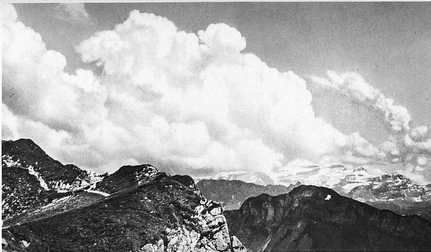
Effet de nuages au sommet des Rochers-de-Naye Auf dem Gipfel der Rochers-de-Naye