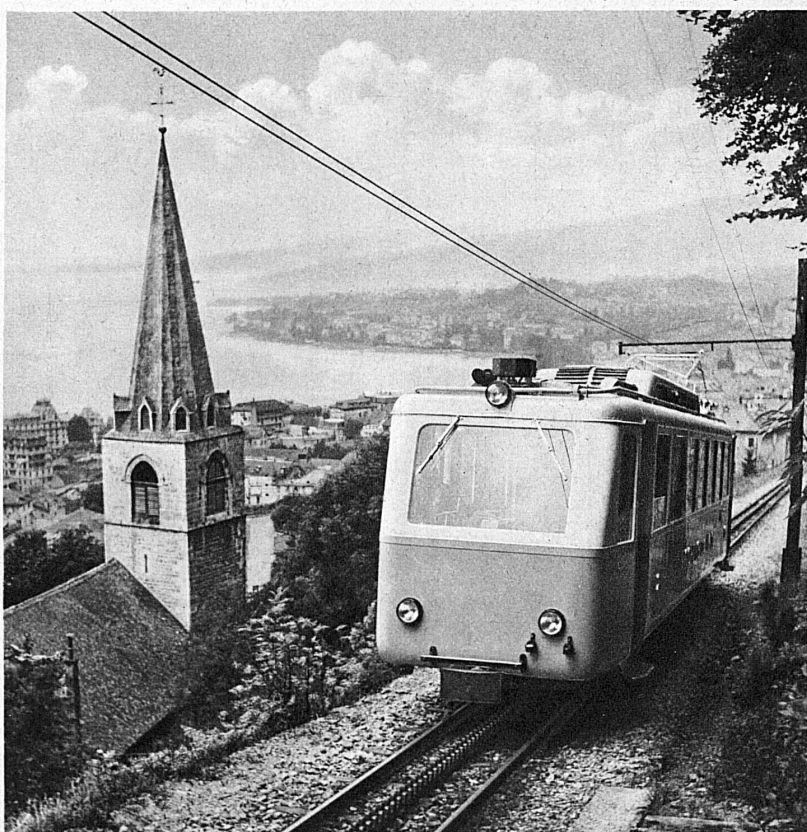
L'autorail du chemin de fer des Rochers de Naye, la baie de Montreux et l'église des Planches — Der neue Triebwagen der Rochers de Naye-Bahn, die Bucht von Montreux und die Kirche von Les Planches