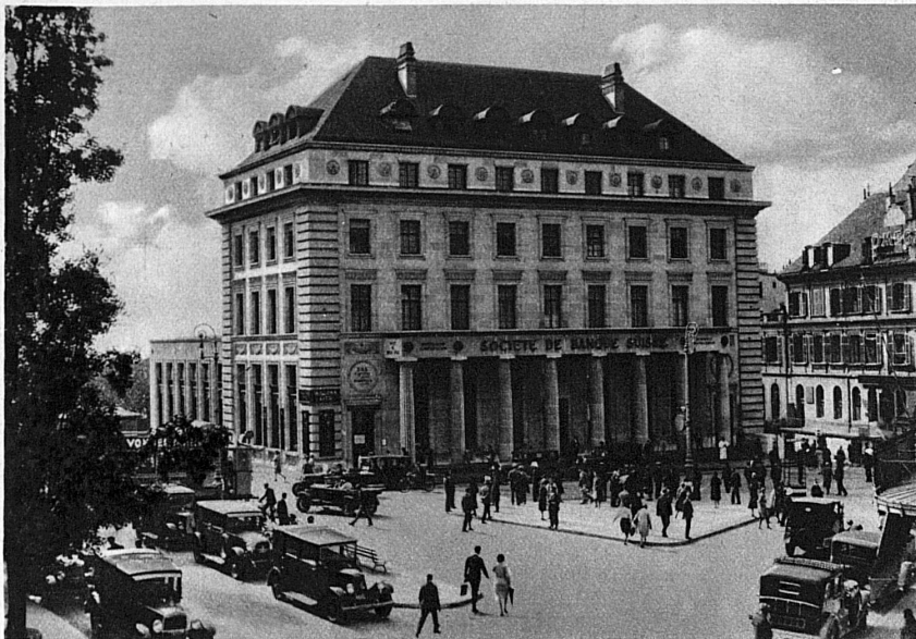
Sitz in Lausanne . Siège de Lausanne