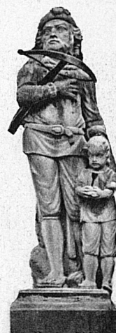
Alte Tellgruppe aus der Innere Schweiz — Tell et son fils, sculpt. de la Suisse centrale — An old «Tell» group from Central Switzerland

even saw the Tell country. The idea of freedom so dear to the great German poet and the historical significance which he attached to the character of the first Confederation formed by the peasant folk, has given his work such a clear, genuine hall-mark that right from the start the Swiss people saw in it the finest interpretation and form of their greatest national heroic character. For several decades now two main Swiss «Volkstheater» have regularly staged Schiller's «William Tell» with the