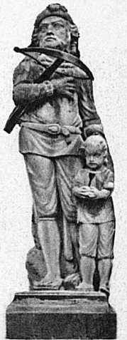
Alte Tellgruppe aus der Innerschweiz — Tell et son fils, sculpt. de la Suisse centrale — An old «Tell» group from Central Switzerland

even saw the Tell country. The idea of freedom so dear to the great German poet and the historical significance which he attached to the character of the first Confederation formed by the peasant folk, has given his work such a clear, genuine hall-mark that right from the start the Swiss people saw in it the finest interpretation and form of their greatest national heroic character. For several decades now two main Swiss «Volkstheater» have regularly staged Schiller's «William Tell» with the