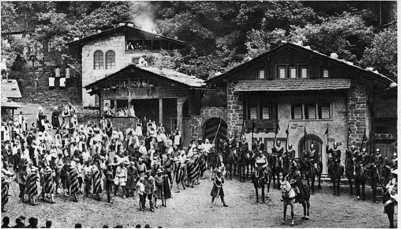
Die Apfelschuss-Szene auf der Freilichtbühne Interlaken — La scène de l'arbalète sur le théâtre à ciel ouvert d'Interlaken — The Apple Scene from the «Tell» Open-air Play at Interlaken