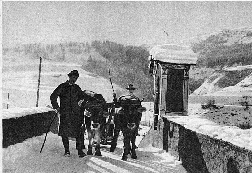
Sur le pont de la Julia à Savognin dans l'Oberhalbstein – Auf der Juliabrück in Savognin, Oberhalbstein