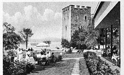
Stansstad am Vierwaldstättersee mit seinem alten Turm

Purtuttavia, il Ticino avrà un centro suo proprio di attrazione, e cioè il Grotto tici- nese, costruito secondo i canoni dell'archi- tettura tipica locale, con porticati, logge, interni rustici, terrazze, pergolati e gioco delle bocce: tutto quanto insomma concorre a fare di questo ambiente la gioconda serenità e armonia. Situato sulla riva del lago, fornito di tutti i prodotti della cucina e can- tina locali, esso è destinato a diventare uno dei centri più frequentati dell'Esposizione. Sarà un pezzo di vita ticinese, trasportato sulle rive idilliche del lago di Zurigo, a portarvi il calore dell'anima e della terra ticinese: non solo col sapido nostranello dei vigneti solatii e coi deliziosi piatti al- l'italiana, ma con la presenza di gruppi fol- cloristici, nei costumi delle valli, che offri- ranno ai visitatori leggiadre collane di canzoni rusticane e scintillanti sorrisi di forosette ardenti.