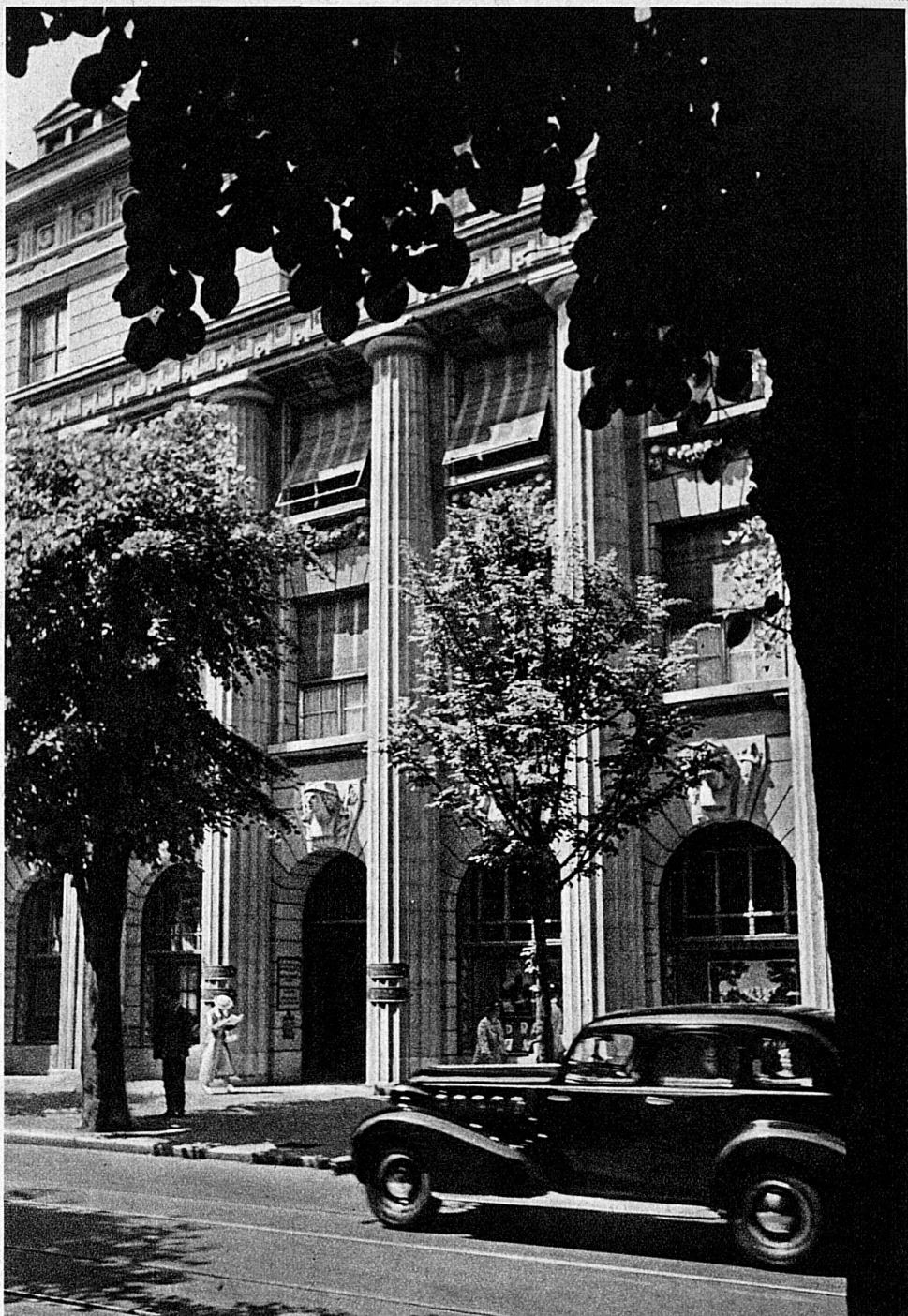
Eingang zum Bankgebäude in Zürich