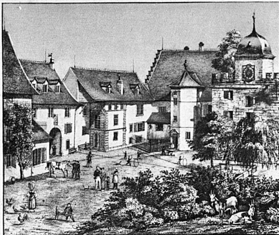
Der Schlosshof zu Anfang des 19. Jahrhunderts — La cour du château au début du 19 e siècle