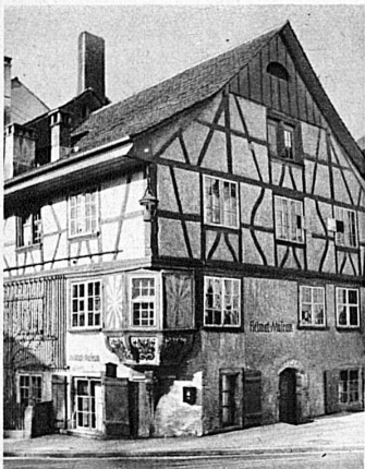
Das Heimatmuseum — Le Musée historique

Festspiel: «Wir schaffen, spielen und tanzen»: 7., 9., 10., 12., 14., 17. Juli, 20¼ Uhr Kostümierte Festumzüge: 10., 14., 17. Juli