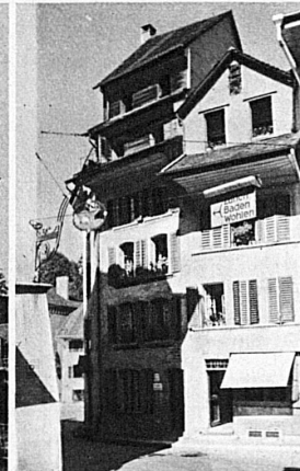
Alte Häuser in Lenzburg — Vieilles maisons du petit bourg