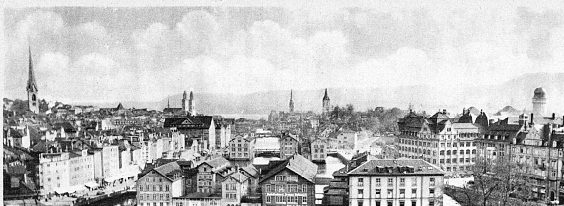
Zurich, la ville de l'Exposition nationale 1939 — Zürich, die Stadt der Landesausstellung 1939