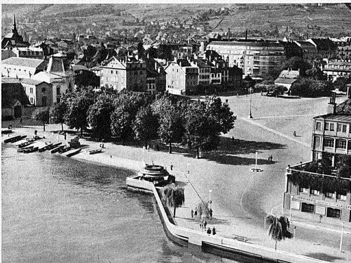
Vevey, siège de la célèbre confrérie des Vignerons et de la Foire annuelle des Vins vaudois – Vevey, die Stadt der berühmten Confrérie des Vignerons und der jährlichen waadtländischen Weinmesse

Pour la sixième fois, la jolie ville de Vevey met au point une manifestation qui mérite de retenir l'attention de tous les amis du vignoble