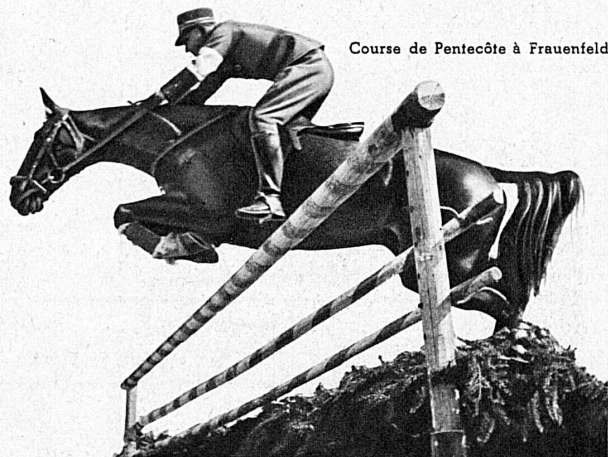
Course de Pentecôte à Frauenfeld