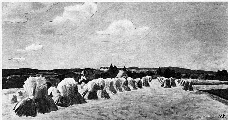
V. Surbek, Bernische Landschaft – Paysage bernois

Eine der kraftvollsten Persönlichkeiten der Schweizer Künstlergeneration, die heute in den fünfziger Jahren steht, ist der Berner Maler Victor Surbek, der sich durch eigenartige Fresken (Zeitlockenturm Bern, Städtisches Gymnasium Bern, Kurbrunnenanlage Bad Rheinfelden) und durch seine grossgeschauten Landschaftsbilder einen Namen gemacht hat. Die Ausstellung in der Bündner Kantonshauptstadt wird Gelegenheit geben, die Reichhaltigkeit und Schönheit seiner Werke zu bewundern.