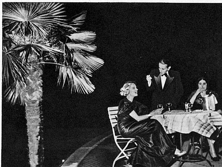
«Notturmo» in Lugano — Notturmo à Lugano