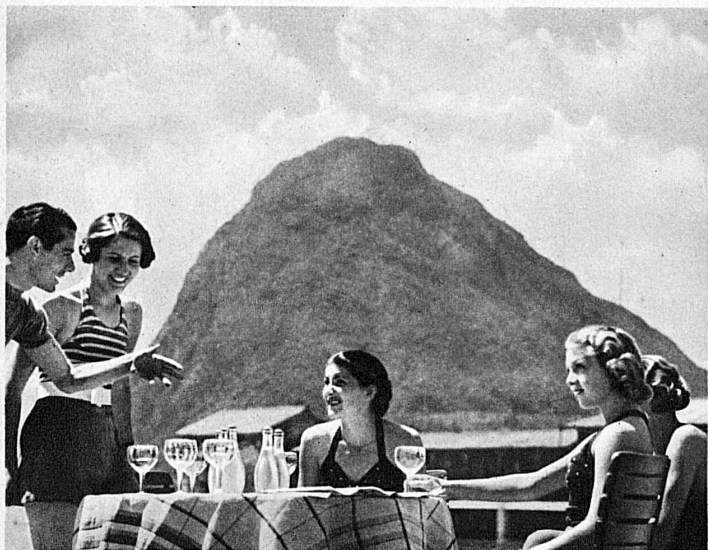
Am Lido Lugano. Der San Salvatore — Lido Lugano. Le Monte San Salvatore