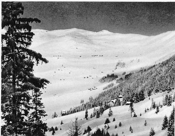
Verbier. Les pentes de la Croix de Cœur — Die Skihänge des Croix de Cœur-Berges bei Verbier

L'alpiniste regarde avec un peu de dédain ces skieurs « à pente unique », qui passent leur temps à monter et descendre les mêmes 300 mètres comme la mouche sur la vitre. Il attend nostalgiquement son heure, celle où la vraie montagne lui rouvrira ses vrais déserts et les routes impolluées de ses cimes. Les skis ne sont pas pour lui des jouets d'appartement, mais des engins d'exploration. Il ne serait pas étonnant que la mode de l'alpinisme hivernal supplantât peu à peu celle du ski-toboggan, quand tout le monde se sentira bien assuré sur les lattes. Car la première vous promet des joies plus éclatantes et, tout de même, des satisfactions d'amour-propre d'un autre ordre. A cet égard, les stations qui organisent leurs semaines d'alpinisme d'hiver font œuvre de pionnières.