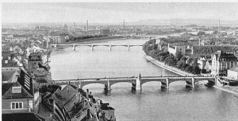
In der Rheinstadt Basel haben sich eine grosse Zahl wichtiger Industrien angesiedelt — Bâle, carrefour des routes du trafic, est un gros centre de navigation fluviale et d'industries variées