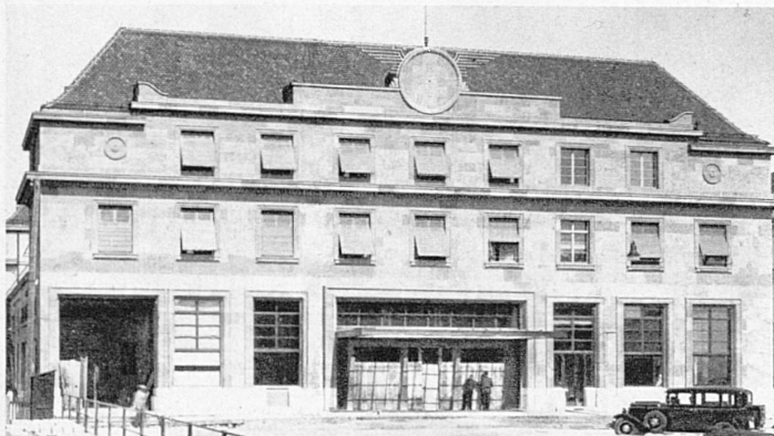
So sieht der neue eben vollendete Neuenburger Bahnhof aus – La nouvelle gare de Neuchâtel