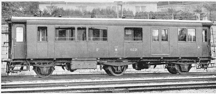
Ein dreiachsiger Krankenwagen der SBB – Wagon à trois axes des CFF destiné au transport des malades