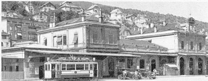
Das alte Bahnhofgebäude in Neuenburg aus den Jahren 1880–82 – L'ancien bâtiment de la gare de Neuchâtel datant des années 1880–1882