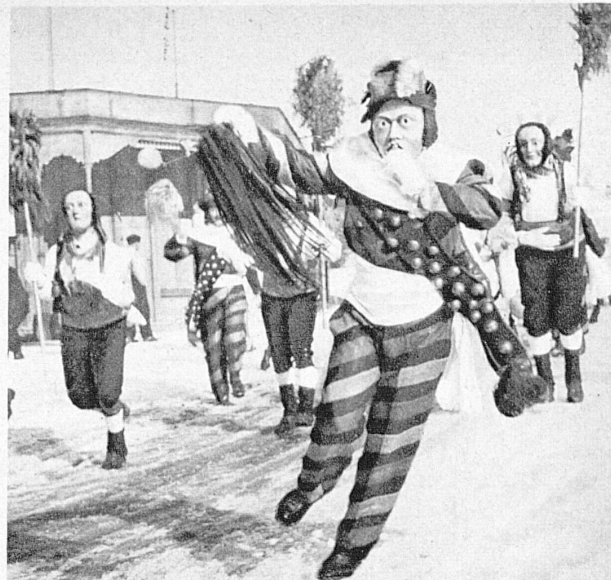
Der Tanz der Brotauswerfer in ihren uralten Kostümen auf dem Einsiedler Klosterplatz – Les distributeurs de pains, vêtus de leurs anciens costumes, exécutent leur danse sur la place du Couvent

In Einsiedeln, dem innerschweizerischen Wallfahrtsort, lebt alljährlich zur Fastnachtszeit ein alter Brauch wieder auf, das sogenannte « Brotausteilen ». In originellen Fastnachtsgewändern tanzen Maskierte auf dem Klosterplatz und begeben sich dann zu den verschiedenen Bäckern ins Dorf, um Brote zu holen. Die Schuljugend wird dabei als Sackträger verwendet. Unterdessen durchziehen Treichelträger unter tosendem Kuhschellengeläute das innere Dorf, um die Bevölkerung auf die Hauptplätze zu locken, wo die Brote ausgeworfen werden.