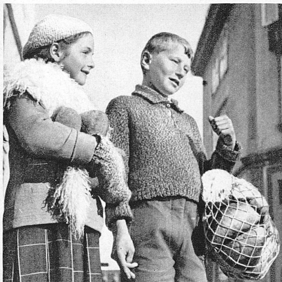
Reich beschenkt kommen die Kinder nach Hause – Les enfants s'en reviennent chez eux chargés de leur butin

Auf drei bis vier Plätzen sind Kleinbühnen errichtet worden, wo die Brotauswerfer die schwerbeladenen Säcke hinbringen und die einzelnen Brote nach allen Richtungen in die Menge werfen. « Mir eis, mir eis! » ruft mit ausgestreckten Händen das Volk und sucht sich möglichst viele Brote zu ergattern. Inzwischen hebt in den umliegenden Gasthöfen ein frohes Getriebe an. Masken, Schellenträger und Jungvolk wiegen sich im Tanze zu den Klängen einer urchigen Ländlermusik.