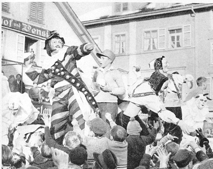
Links: Hier werden die Brote von einer erhöhten Holz Bühne aus unter die Menge geworfen – A gauche: Distribution des pains du haut du tréteau