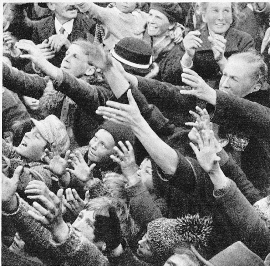
Mir eis! Mir eis! ruft die Menge und streckt die Arme nach den Broten aus – « A moi un! A moi un! » crie la foule en tendant les bras vers la manne