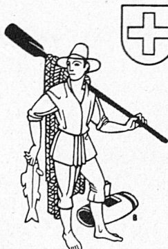
PESTALOZZI KALENDER 1938