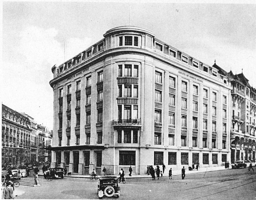
Sitz in Genf — Siège de Genève