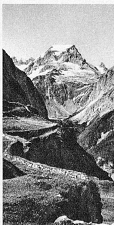
Todi (Kt. Glarus)