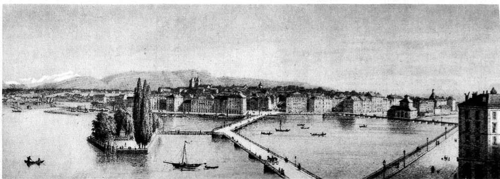
Une vue de Genève au XIX me siècle, avec le Pont des Bergues construit par Dufour — Eine Ansicht von Genf im 19. Jahrhundert mit dem von Dufour erbauten Pont des Bergues

1815 — Genève recouvre son indépendance et devient suisse. Dufour renonce à tous les honneurs qui l'attendent en France, et va consacrer cinquante années de sa vie à servir son pays.