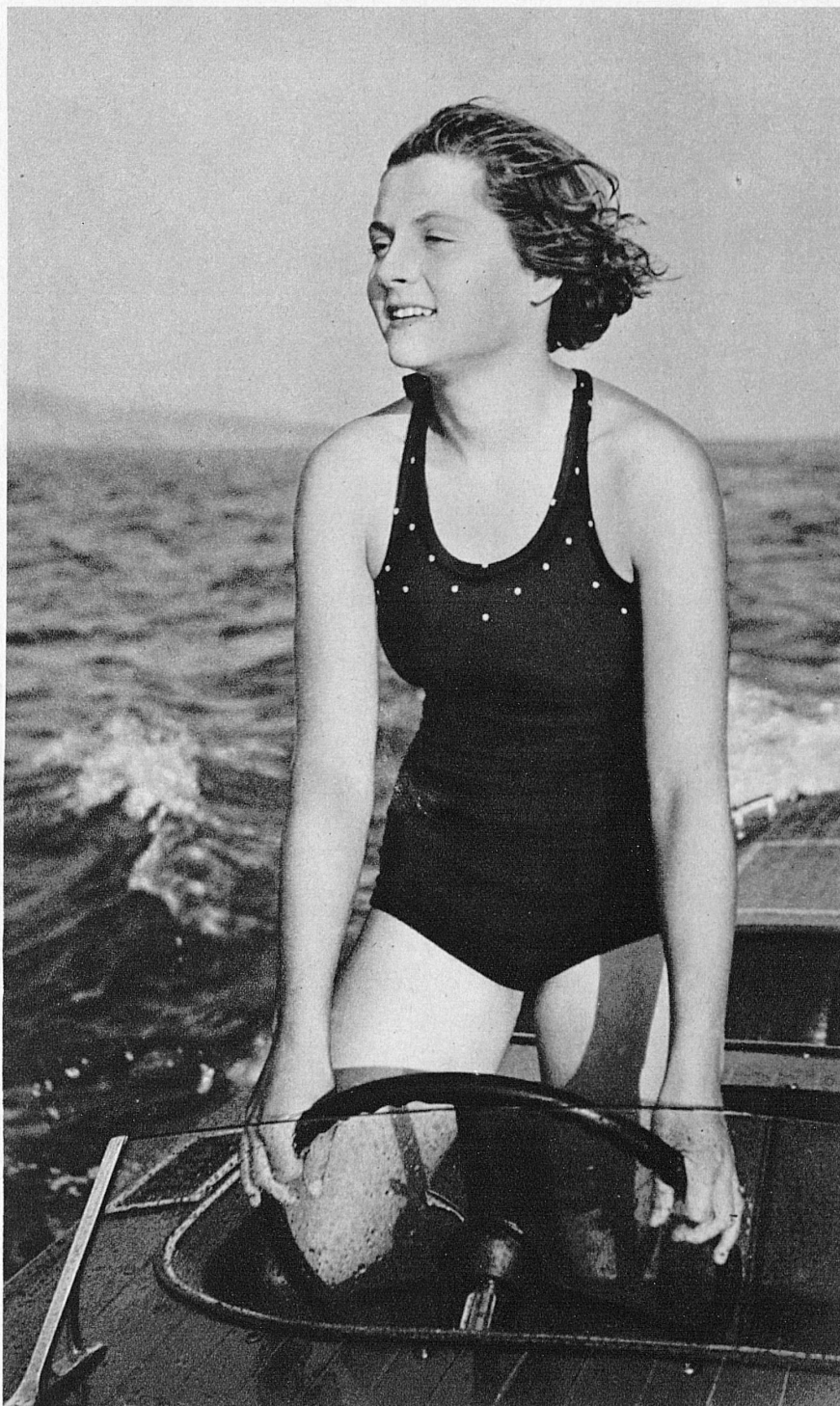
Sur le Lac de Zurich — Auf dem Zürichsee

La Suisse entre autres, avec ses 600 lacs, sa surabondance d'eaux vierges, ses fleuves, rivières, vasques et torrents, et son grand rythme touristique, est sans doute appelée à jouer son rôle dans les développements de la chose balnéaire, dans la nouvelle culture du corps en liberté. Car aux bienfaits courants des plages de la plaine — de ces lidos urbains qui sont devenus nos casinos modernes, où l'on bridge entre deux « pleine eau » et où l'on plonge entre deux cocktails — la Suisse ajoute les bienfaits propres de l'air et du soleil des altitudes, les charmes d'une nature où la liberté du corps se trouve à l'unisson de la liberté des choses, cette salubre compagnie des choses de la montagne enfin, dont on ne dira jamais assez les vertus de détente et de dépouillement, les instillations généreuses dont elles vous pénètrent sans effort. Le corps en liberté dans la nature en liberté, cette formule des plages alpines suisses, c'est pour l'instant ce qu'on a trouvé de mieux dans la recherche de l'euphorie.