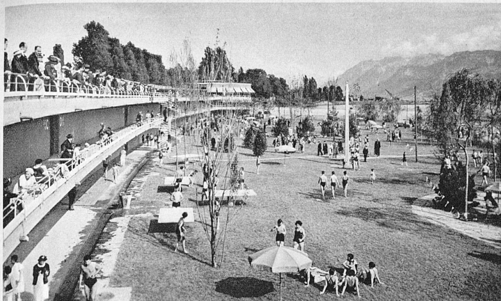
La nouvelle plage de Lausanne-Bellerive — Das im Juli eröffnete neue Lausanner Strandbad, Bellerive-Plage