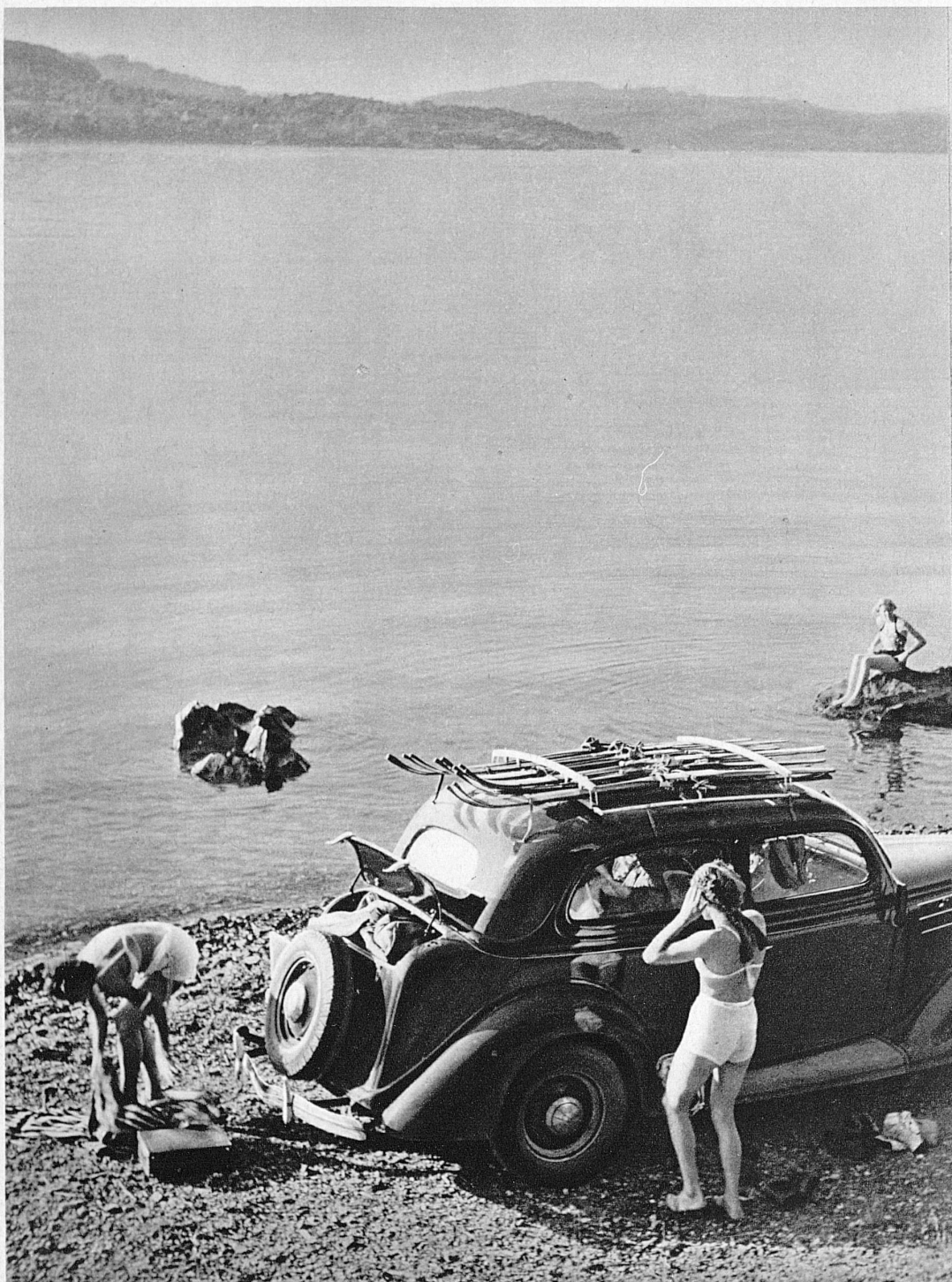
Les délices de la plage après les joies de ski d'été. A Stansstad, aux bords du Lac des Quatre-Cantons — Nach der Sommerskitour an den Seestrand! In Stansstad am Vierwaldstättersee