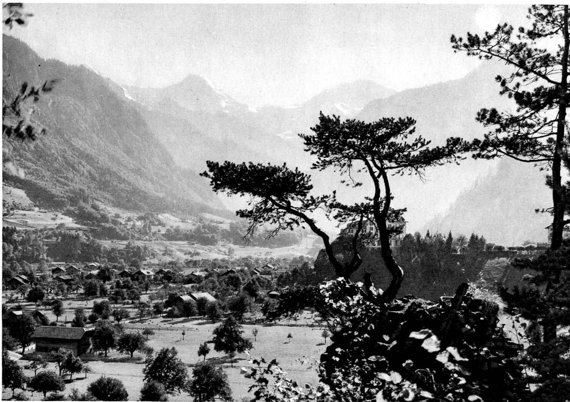
Wilderswil bei Interlaken, am Eingang des Lütchinentales. Im Hintergrund Mönch und Jungfrau - Wilderswil près Interlaken, à l'entrée de la vallée de la Lutschine. En arrière le Mönch et la Jungfrau