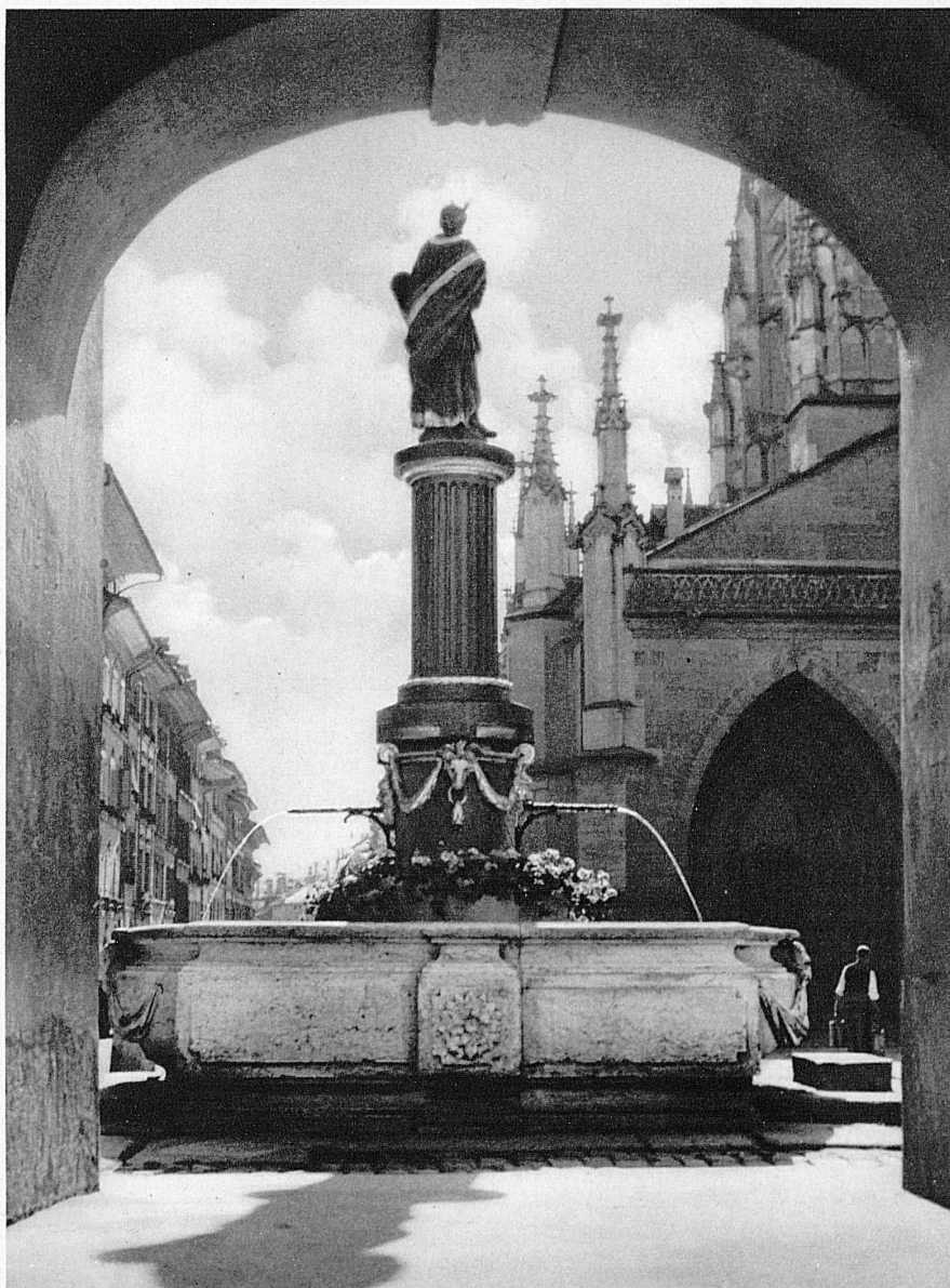
Käftigturm und Anna Seiler Brunnen in der Marktgasse – Le Käftigturm et la Fontaine d'Anna Seiler à la Marktgasse