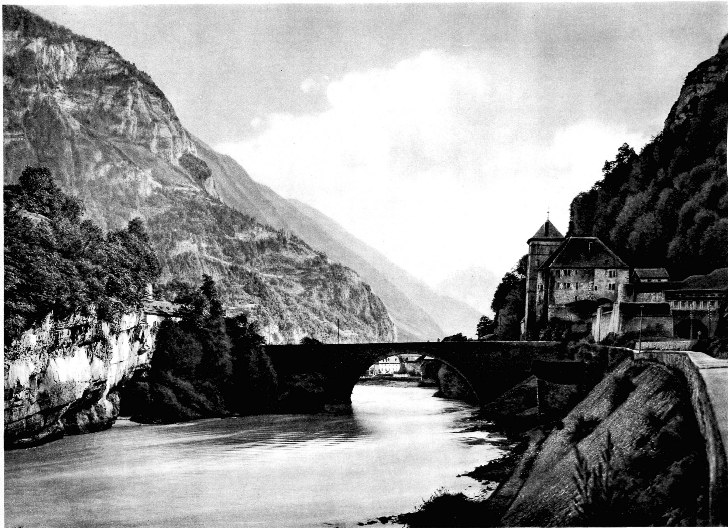
Le défilé de Saint-Maurice — Schloss und Brücke von Saint-Maurice, an der Grenze von Wallis und Waadt