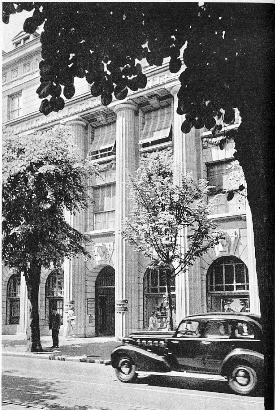
Eingang zum Bankgebäude in Zürich

Les prix indiqués sont ceux du voyage aller et retour par train spécial, surtaxe pour trains directs comprise. Toutefois, dans la plupart des cas, on peut obtenir des billets valables pour l'aller par train spécial et pour le retour individuel dans les dix jours, ou, inversement, pour l'aller individuel la veille et le retour par train spécial. Les gares d'où l'on peut atteindre le train spécial au moyen des trains ordinaires délivrent aussi des billets au prix du train spécial. Pour tous renseignements, s'adresser aux guichets des gares.