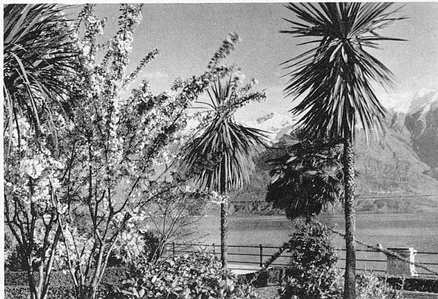
La belle saison à Locarno - Lenz in Locarno

In kleinern Verhältnissen umfasst der Kanton Tessin, südlich des Gotthard, alle Klima- und Vegetationsstufen der Schweiz. In der Zone der insubrischen Seen gedeiht vereinzelt der Olivenbaum. Bis Bellinzona trifft man die Zypresse; der Weinstock erreicht seine Grenze bei 700 m, die Edelkastanie steigt hinauf bis auf 900 m. An diese eigentlich südlichen Regionen schliessen sich die Laub- und Nadelwaldgürtel, das hochgelegene Alpweidengebiet und endlich über 2800 m die nivale Zone an. Von den zirka 1850 Pflanzenarten der Schweiz kommen 75 % auch im Tessin, 100 Spezies nur im Tessin vor. Kein Wunder, dass ein so bevorzugter Landstrich, der zugleich alle landschaftlichen Schönheiten von Seen und Bergen in sich schliesst, als eines der schönsten Feriengebiete Europas gilt.