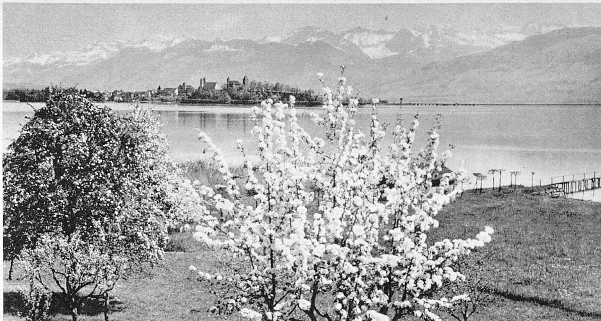
Am obern Zürichsee bei Rapperswil - Printemps à Rapperswil au bords du Lac de Zurich

Das untere Ende des Zürichsees wirkt wie die Glanzleistung eines genialen Städtebauers: eine heitere Wasseroberfläche spendet Frische und Himmelsbläue inmitten einer locker gebauten Gartenstadt.