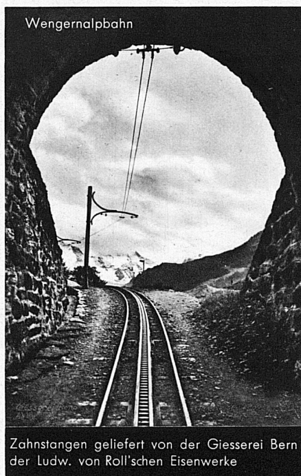
Zahnstangen geliefert von der Giesserei Bern der Ludw. von Roll'schen Eisenwerke

Walzwerke · Schmiede · Giessereien · Elektrostahlwerk · Mech. Werkstätten