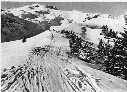
Am Weg zur Maskenlücke