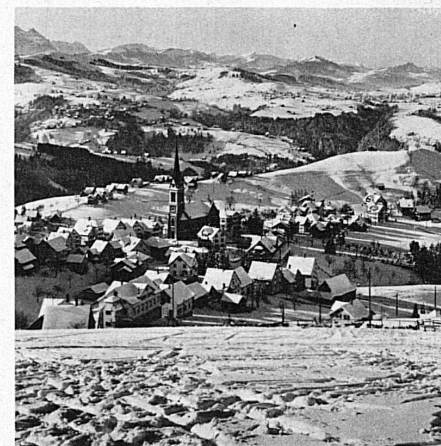
Das fröhliche Winterland Appenzell — Le joyeux hiver d'Appenzell

Arosa. 12. Januar: Arosener Slalomprüfungen. 18./19. Januar: Schweiz. Kunstlaufmeisterschaften.