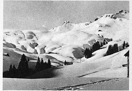
Herrlicher Skiwinter in Champéry — Splendeurs d'hiver à Champéry

18/19 janvier: Jeux universitaires, exhibition libre.