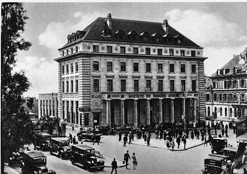
Sitz in Lausanne . Siège de Lausanne