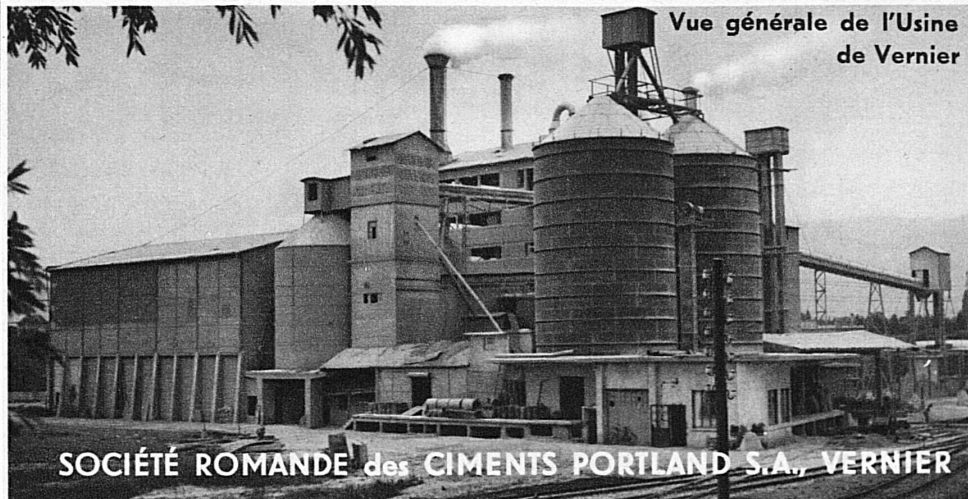
Vue générale de l'Usine de Vernier

SOCIÉTÉ ROMANDE des CEMENTS PORTLAND S.A., VERNIER