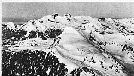
Die grosse Chamossaireabfahrt bei Villars-Chesières-Arveyes