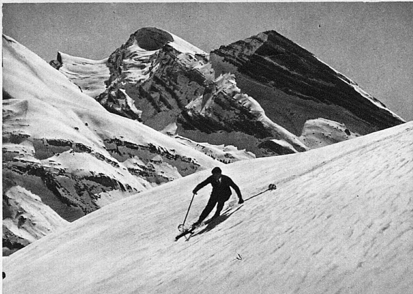
Neige croûtée - Im Harstschnee bei Kandersteg

C'est le vent qui joue peut-être le rôle prépondérant dans le processus d'évaporation. En balayant les molécules de glace échappées de la couche, il empêche