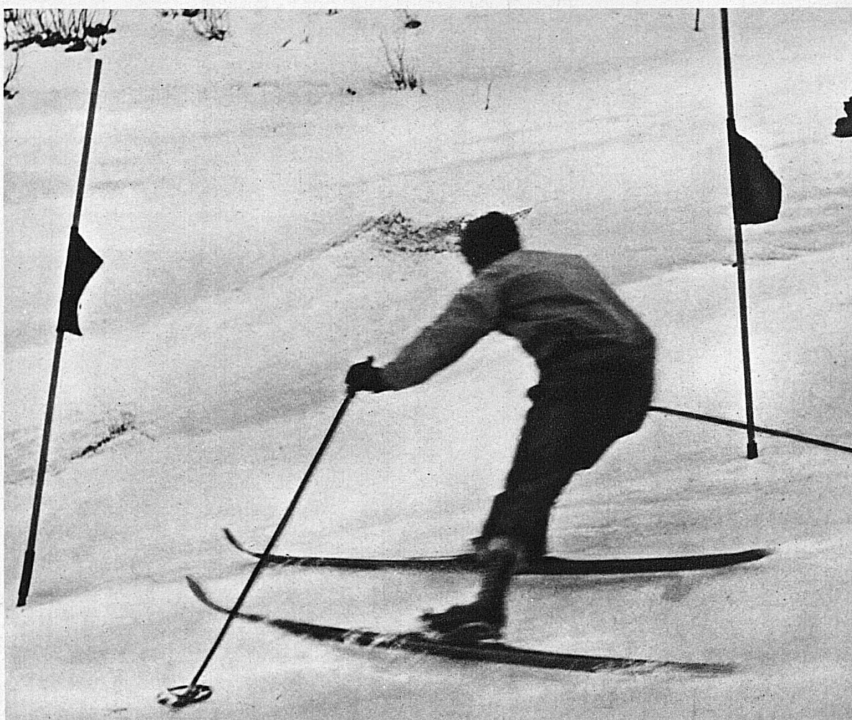
Neige tôle - Verregneter Schnee