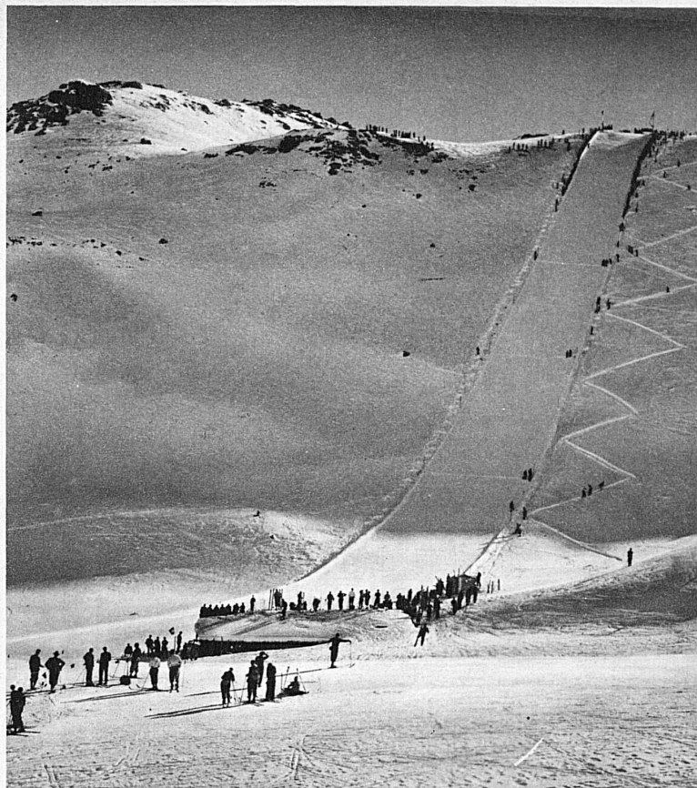
Der Kilometer-lancé-Hang im Val Saluver – Piste du Kilomètre lancé dans le Val Saluver

In tiefe Hocke geduckt, die Hände am Bügel der Stromliniensi, am Rücken die « Luftschneidemaschine » aufmontiert, erreichen die Fahrer auf der Kilometer-lancé-Strecke im Val Saluver eine Geschwindigkeit von über 130 Kilometer. Die breiten, mit Bleiplatten belegten Latten sind 30 Kilogramm schwer. Das konstante Gefälle der Prüfungsstrecke beträgt 35—36 Grad.