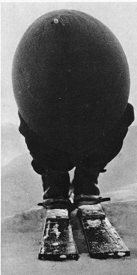
Die « Windschneidemaschine » von hinten – La « machine à couper l'air » vue de derrière