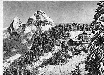
Die Drahtseilbahn Schwyz-Stoos und die Mythen — Le funiculaire Schwyz-Stoos et les Mythen

11.-12. Januar: Nach Stoos (Wochenend). Fahrpreis Fr. 13.85.