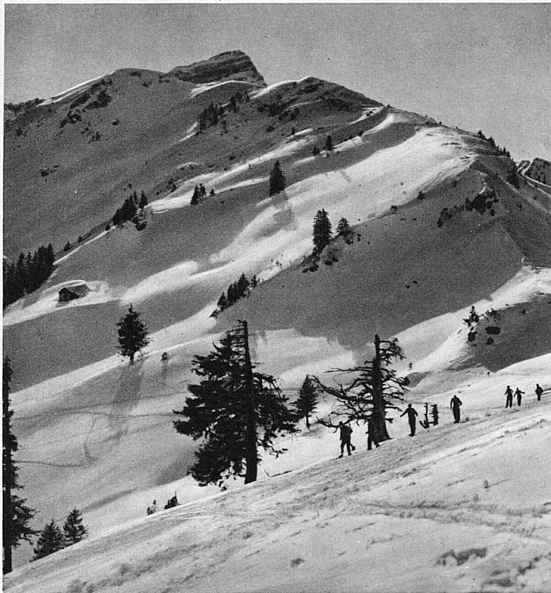
Bei Nesslau im Obertoggenburg