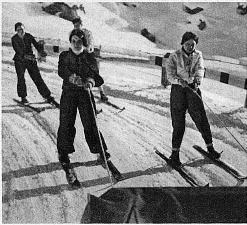
Ski-jöring derrière auto sur la route du Julier (Grisons) - Auto-Skijöring auf der Julierstrasse (Graubünden) - Motor-ski-kjøering on the Julier Pass road (Grisons) - Skijöring automobilistico sulla strada del Giulio (Grigioni)