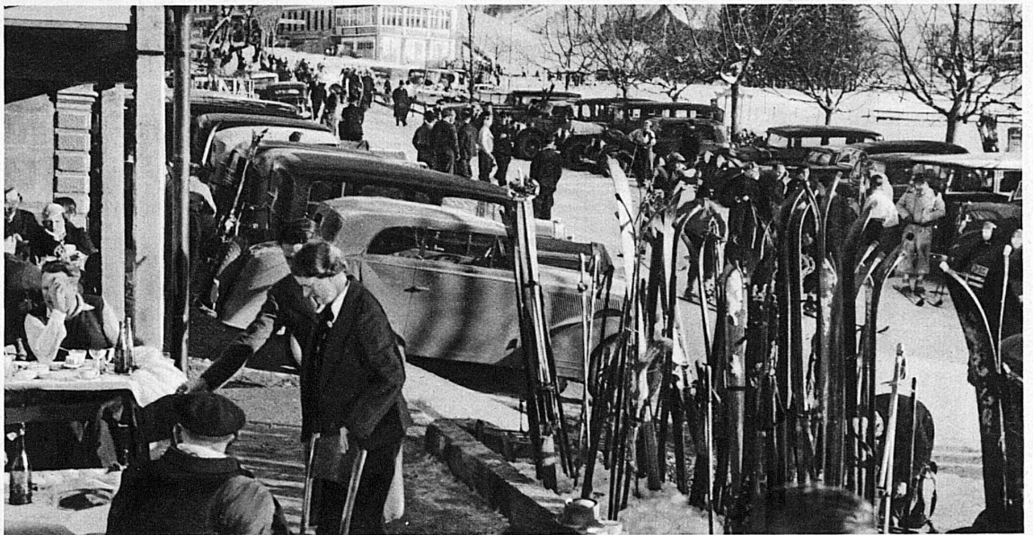
Rallye automobile à Unterwasser dans le Toggenbourg (Suisse orientale) - Grossbetrieb in Unterwasser im Toggenbourg (Ostschweiz) - Great days at the winter resort of Unterwasser (Eastern Switzerland) - Giorno movimentato a Unterwasser nel Toggenburgo (Svizzera centrale)

können Sie im Winter in die Schweiz fahren. Die Grenzformalitäten sind denkbar einfach. Als Zolldokument genügt bis zu einem 40tägigen Aufenthalt die provisorische Eintrittskarte zu Fr. 2 für 10, Fr. 4 für 20 und Fr. 6 für 40 Tage. Für Führer und Wagen genügt der nationale Führer- und Fahrzeugausweis. Die Zufahrt zu vielen, dem Auto zugänglichen Kurorten wird auch im Winter offen gehalten. Ganzjährig geöffnet sind die Alpenstrassen über (Zürich-) Chur - Lenzerheide - Julier - Maloja (-Mailand), über den Ofenpass (St. Moritz - Zerne - Merano) und über den Col des Mosses (Freiburg - Genfersee). Die Bundesbahnen, die Lötschbergbahn und die Rhätische Bahn besorgen zu mässigen Tarifen den Autotransport durch die grossen Alpentunnels (Gotthard, Simplon, Lötschbergbahn, Albula). In zahlreiche Wintersportgebiete führen auch die bequemen, geheizten Wagen der Eidgen. Postverwaltung.