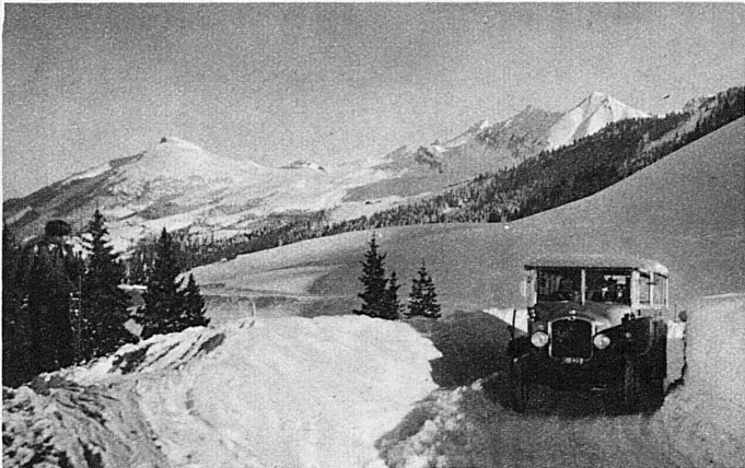
En auto-chenille pour le Hahnenmoos près d'Adelboden (Oberland bernois) - Mit dem Auto ins Adelbodner Skigebiet auf Hahnenmoos (Berner Oberland) - By motor-coach from Adelboden to the Hahnenmoos ski-ing fields - Con l'automobile nella regione sciistica di Adelboden-Hahnenmoos (Oberland bernese)