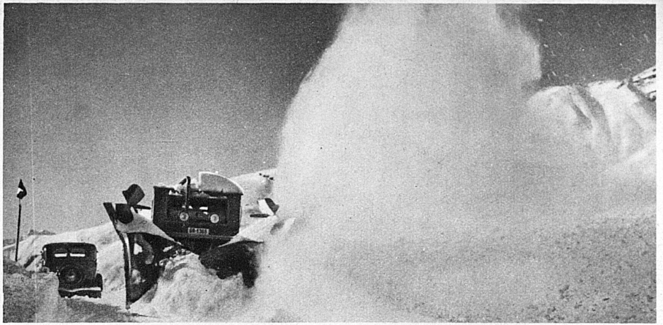
Les chasse-neige géants qui assurent pendant tout l'hiver l'ouverture de la route du Julier - Mit riesigen Schneeschleudermaschinen wird die Julierpass-Strasse den ganzen Winter über offen gehalten - Huge snow-plough machines keep the Julier Pass road open throughout the winter - Grazie a questi giganteschi spazzaneve il passo di Giulio rimane aperto tutto l'inverno