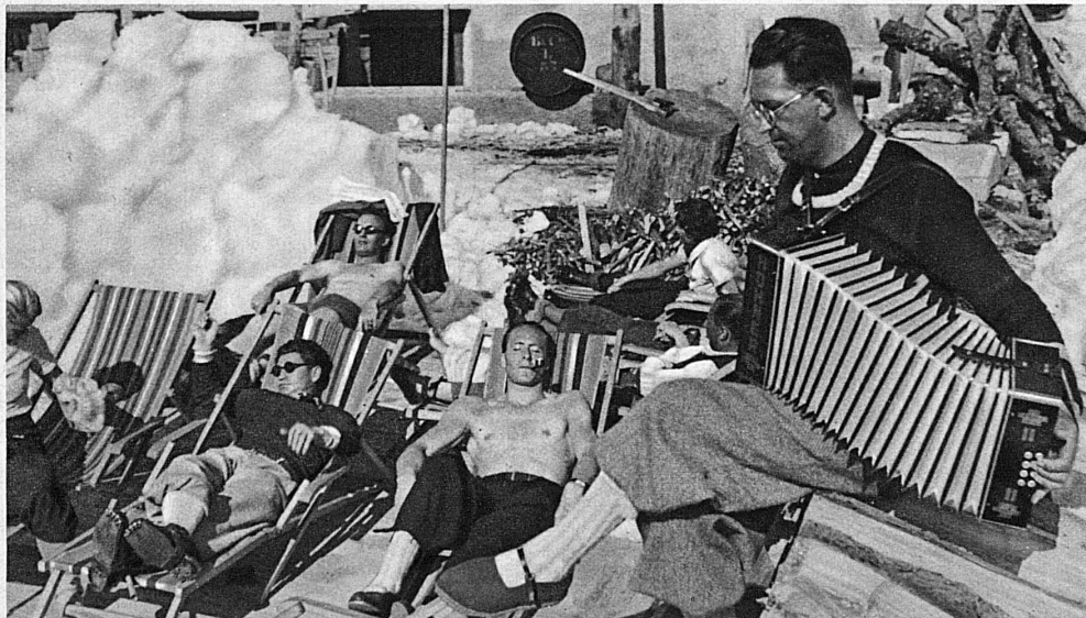
Sieste à la Schwendi après une descente de Parsenn – Ora di siesta sullo Schwendi dopo la discesa del Parsenn – Siesta auf der Schwendi nach der Parsenn-Abfahrt – Happy siesta in warm sunshine on Schwendi, after a Parsenn ski-run