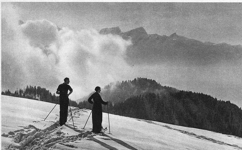
Orgevaux sur Les Avants-Sonloup (Ligne du Montreux-Oberland bernois) – Gioia dello sci nei pressi di Les Avants-Sonloup, sulla linea Montreux-Oberland bernese – Orgevaux bei Les Avants-Sonloup an der Montreux-Oberland-Bahn – A downhill run from Orgevaux near Les Avants-Sonloup, on the Montreux-Oberland Railway

réverbéré par les neiges, imprègne tout de chaleur et de clarté. A la même heure où, dans les villes, vous frissonnez sous vos fourrures et vos manteaux, à 2000 mètres au-dessus de la mer, des skieurs bronzés courent les neiges en costume de bain. Qui donc résisterait à l'appel de l'été blanc des Alpes suisses?