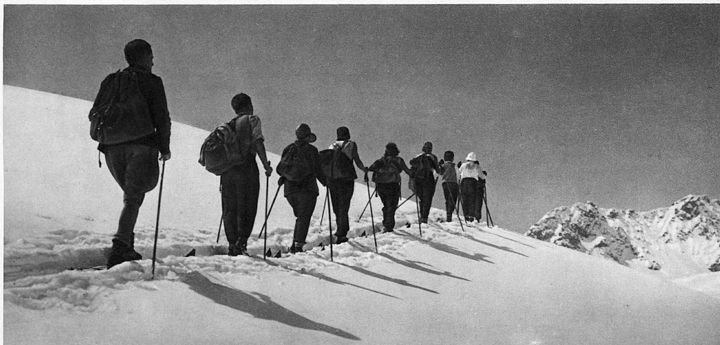
A Group of climbing skiers near Arosa (Grisons) – Im Skitourengebiet von Arosa (Graubünden) – Les fameux tours en ski d'Arosa (Grisons) – Sui campi sciistici di Arosa (Grigioni)