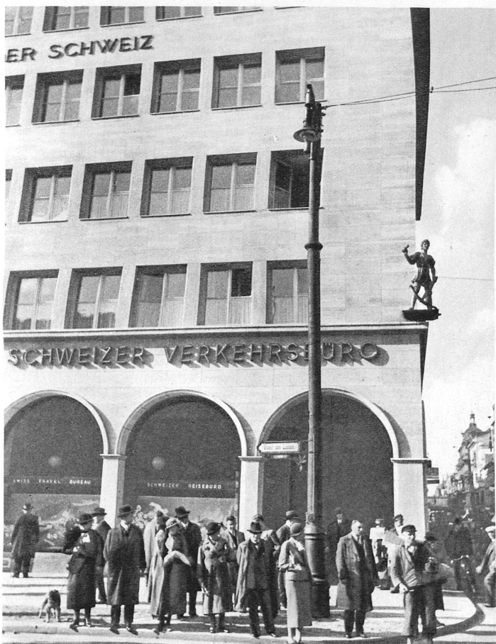
Das Haus der Schweiz Unter den Linden in Berlin - La maison de la Suisse à Berlin « Unter den Linden »

Die Bundesbahnen teilen sich mit der Schweizerischen Verkehrszentrale in die Auslandspropaganda. Bundesbahnagenturen bestehen in London, New York, Paris, Berlin, Wien, Amsterdam, Rom (mit Unteragentur in Mailand) und Kairo, Vertretungen der Verkehrszentrale in Brüssel, Nizza, Prag, Budapest, Mailand (gemeinsam mit den Bundesbahnen), Stockholm und Buenos-Aires. Ein Beamter der Verkehrszentrale besorgt in der Berliner und in der Pariser Agentur den Auskunftsdienst für den Automobil- und Luftverkehr.