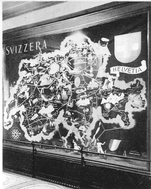
S B B-Werbung in Rom - Les promesses de la Suisse à Rome