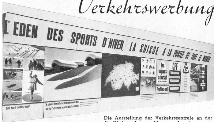
Die Ausstellung der Verkehrszentrale an der diesjährigen Lyoner Messe - La récente exposition de l'ONST à la foire de Lyon