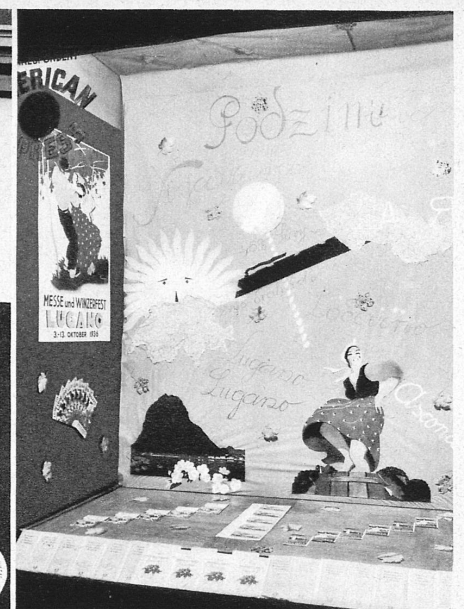
Werbung der Schweizerischen Verkehrszentrale in der Tschechoslowakei - Propagande touristique de l'Office National Suisse du Tourisme à Prague