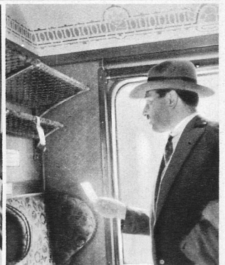
Ihr Platz wird Ihnen reserviert - Vous pouvez réserver une place