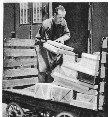
Der Posttransport - Les CFF au service des PTT

reservierung, die Geschenkgutscheine für Bahnfahrten, die Dienste, die Kranken erwiesen werden, die freundliche, zuvorkommende Gesinnung des Personals, nicht zu vergessen: Auskunftsstellen und Fundbureaus, Telegramm- und Telephonübermittlung, Geldwechsel und was dergleichen mehr ist.