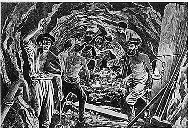
Tunneldurchstich am Gotthard im Februar 1880 – Percement du tunnel du St-Gothard, en février 1880

sich, dem einige Gesellschaften zum Opfer fielen, das andere zur Fusionierung zwang. Die Konjunkturzeit hatte eine Krise im Gefolge, die hinüberleitete zur Verstaatlichung.