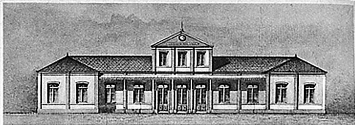
So sah der erste Bahnhof in Neuenburg aus – La première gare de Neuchâtel

Die Bundesverfassung vom Jahre 1848 schuf die Voraussetzungen für