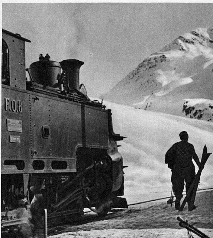
Die Furka-Oberalpbahn im Dienste des Wintersports

Von vier Seiten führt der Schienenweg tief in die Gotthard-Skigebiete hinein. Von Norden über Luzern nach Göschenen und von da durch die Schöllenen nach Andermatt, von Süden in die obere Leventina nach Ambri-Piotta, Airolo und zum Eingang des Bedrettotals, von Westen hoch ins Goms bis Oberwald und im Osten in das schneereiche bündnerische Tavetsch mit seinen stillen Dörfern Sedrun und Tschamutt. Die Furka-Oberalpbahn, die im Sommer über die Pässe hinweg das Wallis mit Graubünden, Zermatt mit St. Moritz verbindet, hält im Winter in der Mitte ihrer Strecke, zwischen Andermatt und Nätschen, den Betrieb aufrecht.