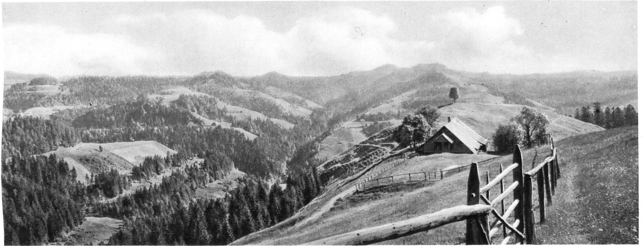
Bristenegg-Alp bei Eriswil – Bristenegg-Alp près d'Eriswil

Wenn die Badesaison vorbei ist und das Hochgebirge neu eingeschneit, locken die Jurahöhen und die Mittellandhügel zu Wanderungen durch Wald und Feld. Während rings der Herbst die schönsten Farben entzündet, leuchten am Horizont die Alpenketten schon im frischen Weiss des bald einbrechenden Winters.