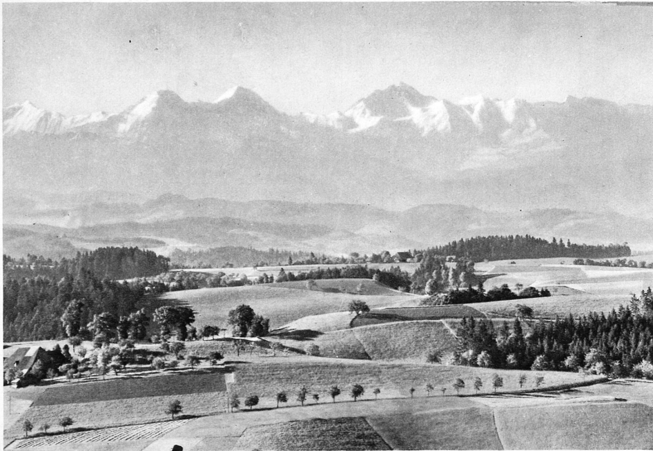
Blick von der Lueg auf die Berner Alpen – Vue de la Lueg sur les Alpes bernoises