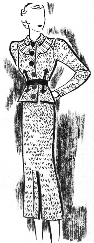
TRICOT ESKA, Zollikofen