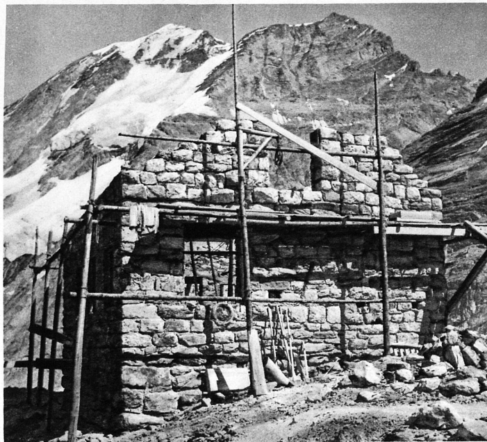
Die Klubhütte im Bau – La cabane du Fründenhorn en chantier