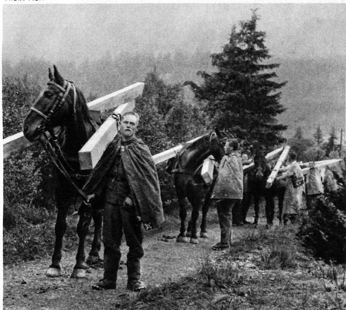
Säumerrekruten transportieren Balken für den Bau der Fründenhornhütte – Les recrues d'un convoi de montagne prêtent leur aide