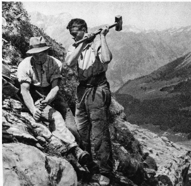
Der Weg wird gebahnt. Zwei Meisterschafts-Skiläufer am Bau der Anlage – On ouvre le sentier dans la roche