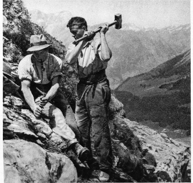
Der Weg wird gebahnt. Zwei Meisterschafts-Skiläufer am Bau der Anlage – On ouvre le sentier dans la roche