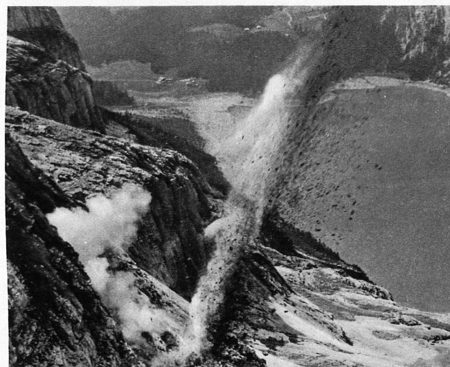
Sprengschuss – in der Tiefe der Oeschinensee – Un beau coup de mine dans les échos du Lac d'Oeschinen