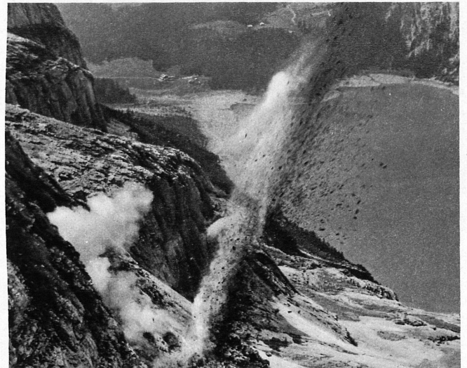
Sprengschuss – in der Tiefe der Oeschinensee – Un beau coup de mine dans les échos du Lac d'Oeschinen