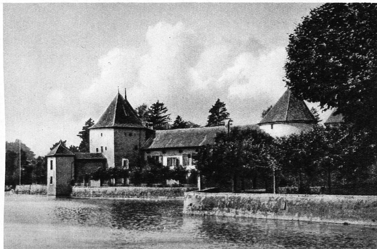
Château de Rolle — Schloss Rolle