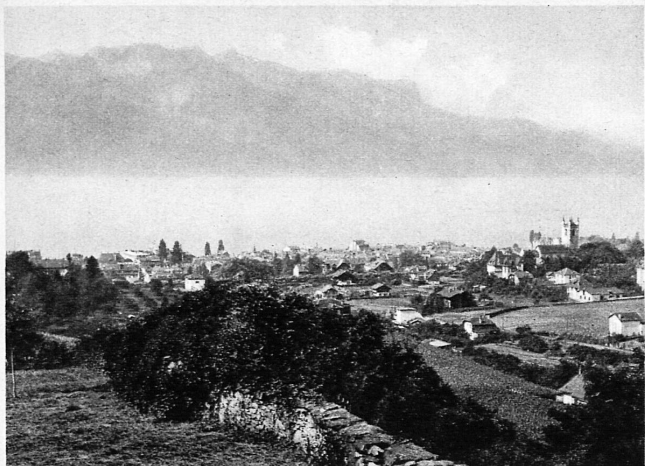
Vevey et les Alpes de Savoie — Vevey und die Savoyer Berge