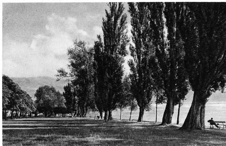
Mail de Cully, entre Lausanne et Vevey — Am Genfersee bei Cully