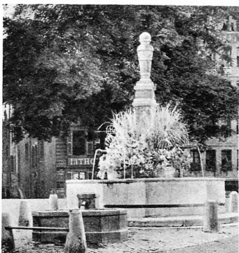
Fontaine au Bourg-de-Four — Bourg de Four

Si l'on aborde Genève par l'eau, on se trouve à un certain moment juste en face de la Cathédrale de Saint-Pierre, dont on voit au loin et au sommet de la cité se profiler les deux tours dans une écharcure naturelle entre le Jura et le Salève. De chaque côté se prolongent les montagnes comme deux ourlets gigantesques ... Tout le reste de la ville est compris entre ces trois éléments — le lac compris — et qu'importe dès lors qu'une rue monte ou descende, qu'un quai accuse une plus grande largeur qu'un autre! Par définition, la cité est équilibrée, contenue, maîtrisée, restreinte aussi. Il faut bien donner au lac un bon point puisqu'il a su s'amincir en vue de Genève et former une sorte de triangle dont le sommet est une ville.