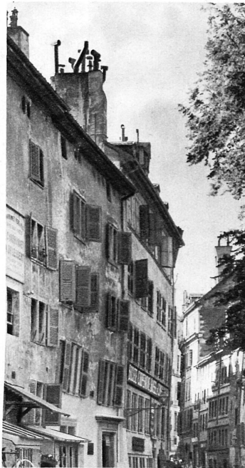
Vieux quartier du Bourg-de-Four — An der Place du Bourg de Four