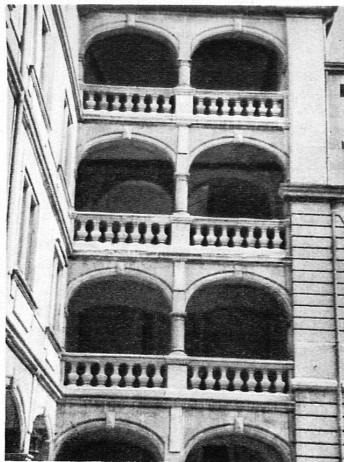
Cour de l'Hôtel-de-Ville — Im Rathaus