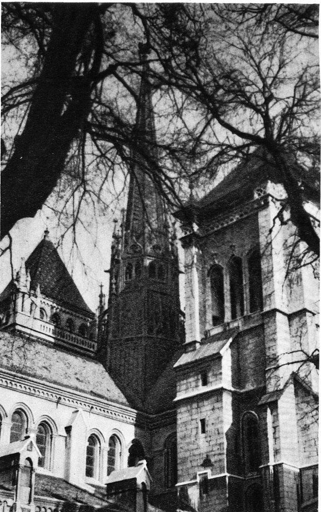
Tours de St-Pierre — St. Pierre