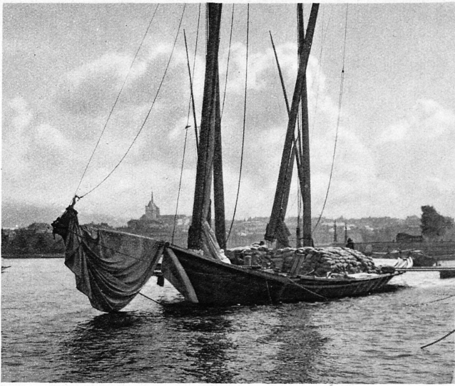
En rade de Genève — Genf von der Seeseite